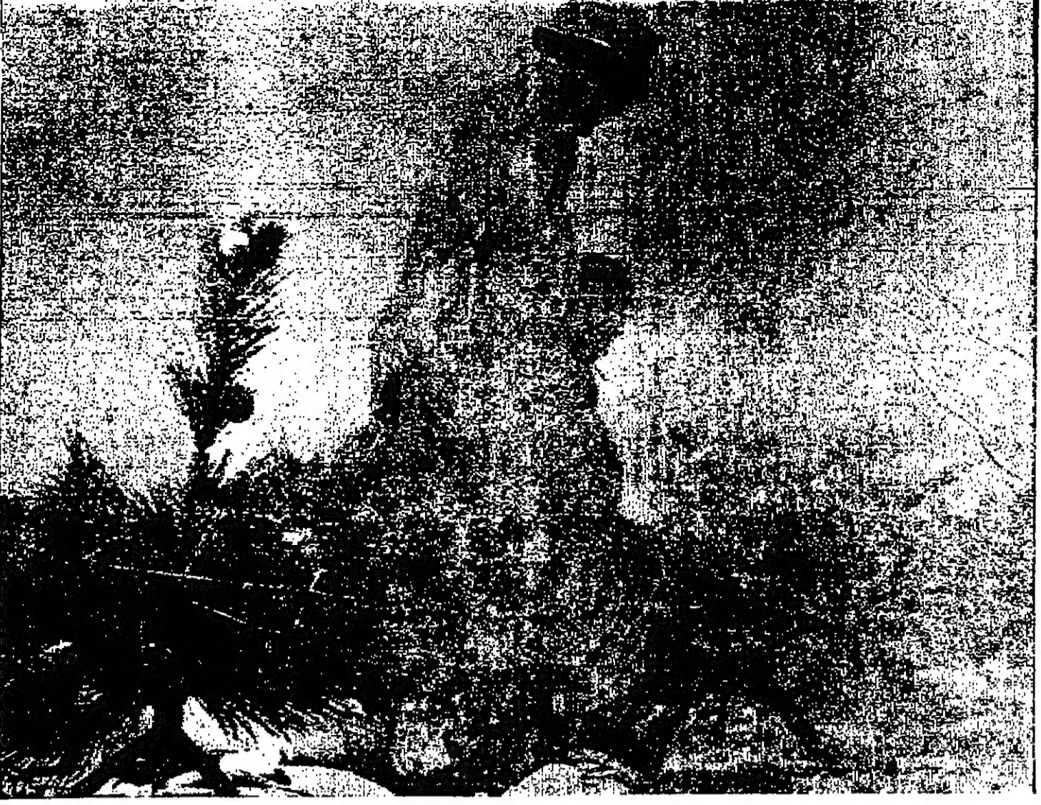
سجرة عيد الميلاد مصنوعة محلياً... صورة لاسلكية خاصة بالصور من نيويورك